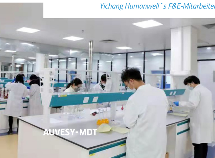
Yichang Humanwell's F&E-Mitarbeiter

Kunden aus der gleichen Branche sollten sich regelmäßig mit den Software-Ingenieuren von AUVESY-MDT treffen, um Erfahrungen bei der Nutzung von versiondog und umfassend zu diskutieren und auszutauschen.